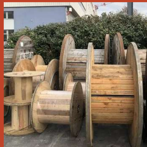
LES TOURETS ↗