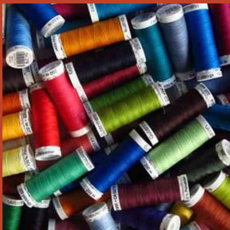
BOBINES DE FILS POUR COUDRE

Dans le spectacle, Sasha et Lulu sont accompagné-es de bobines. Certaines petites, d'autres grandes et une très très grande. En as-tu déjà vu dans ta vie de tous les jours ? Voici plusieurs sortes de bobines que nous croisons quotidiennement.