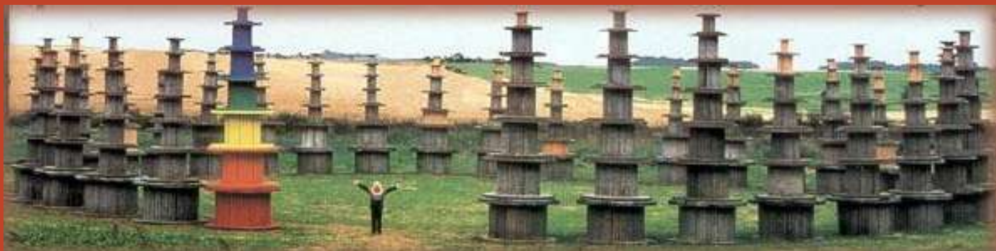
LES PAGODES DE JULOS BEAUCARNE ↘